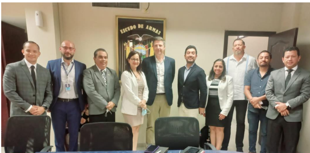
Imagen 2. Reuniones con miembros de la Embajada Norteamericana y Agentes Fiscales de la Provincia

Como coordinadores provinciales se han efectuado trece solicitudes de Asistencia Penal Internacional, de países como: Perú, España, Rusia, Colombia, México y el Salvador manteniendo un registro mensual que es reportado a la Dirección de Cooperación Internacional.