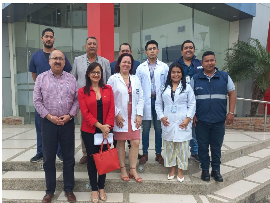
Imagen 4. Reuniones con los servidores del Servicio Nacional de Medicina Legal y Ciencias Forenses de Manta.