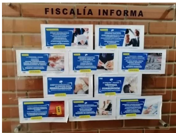
Imagen 1. Cartelera informativa.

En el ingreso del edificio de la Fiscalía Provincial de Manabí, contamos con una cartelera institucional donde se publican semana a semana los resultados obtenidos en casos de conmoción social, así como se informa a la ciudadanía los mecanismos con los cuales cuenta para el pleno ejercicio de sus derechos a través de nuestra institución.