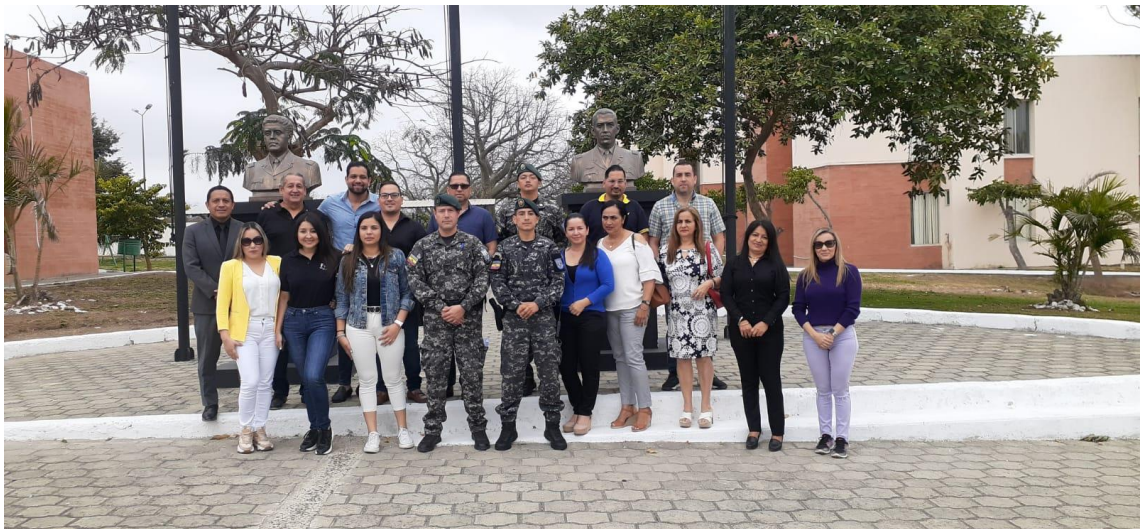
Imagen 9. Seminario de autocuidado personal en las instalaciones del GIR Manta.