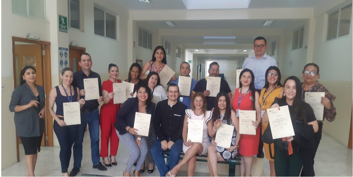
Imagen 8. Entrega de certificado a los asistentes al seminario de Lenguaje de Señas.

delitos de espacios acuáticos, autocuidado GIR-Manta, lenguaje a señas, inteligencia emocional y Protocolo Nacional para Investigación de Muertes Violentas a Mujeres y Niñas.