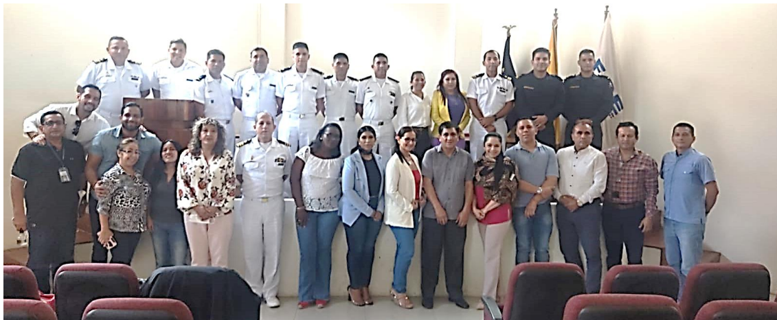
Imagen 10. Seminario de Espacios Acuáticos.