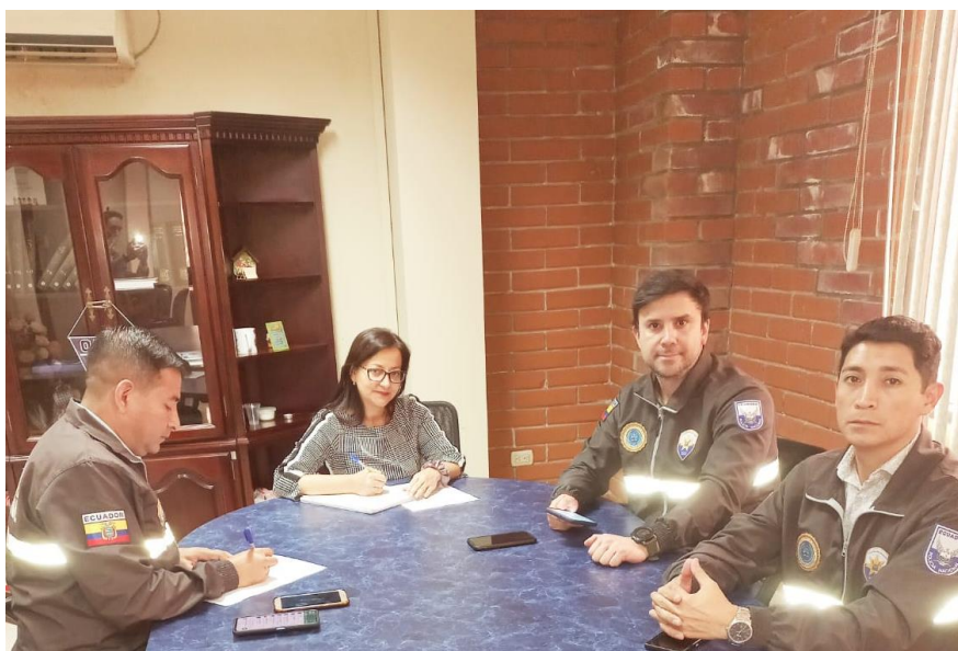
Imagen 3. Reuniones con Unidades Policiales Especializadas.

Seguimos fortaleciendo la participación de la Fiscalía Provincial de Manabí, a través de la participación activa en las diferentes mesas inter – institucionales, con los demás actores de la administración de justicia, Policía Judicial, Antinarcóticos, UNIVIF, DINASED, UNIPEN, Criminalística, UIAN, Defensoría Pública Penal, Defensoría del Pueblo, Corte Provincial de Justicia de Manabí, Secretaría de Derechos Humanos, Gobernación, Ministerio de Salud de Pública, Organizaciones de la sociedad civil, con la finalidad de coordinar el trabajo y obtener mejores resultados.