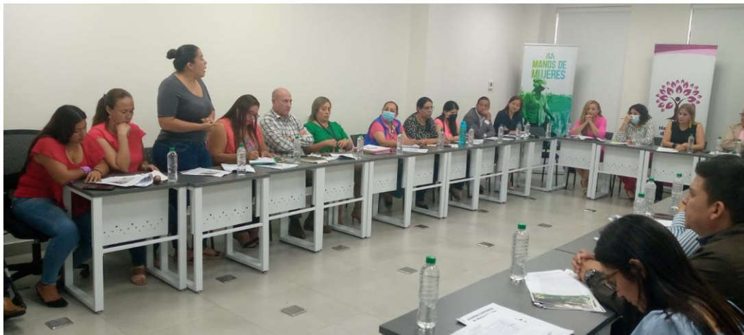
Imagen 5. Reunión con representantes de la sociedad civil.