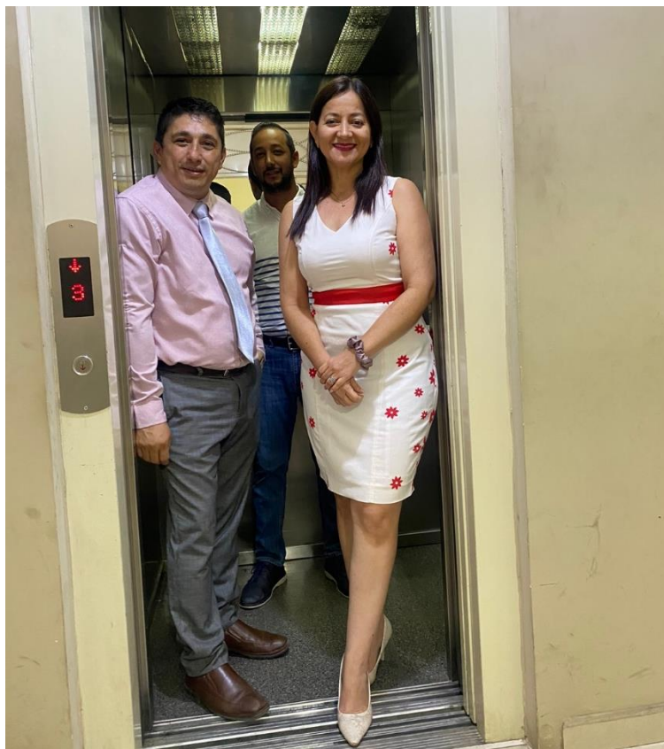
Imagen 7. Ascensor de la Fiscalía Provincial de Manabí en óptimo funcionamiento.