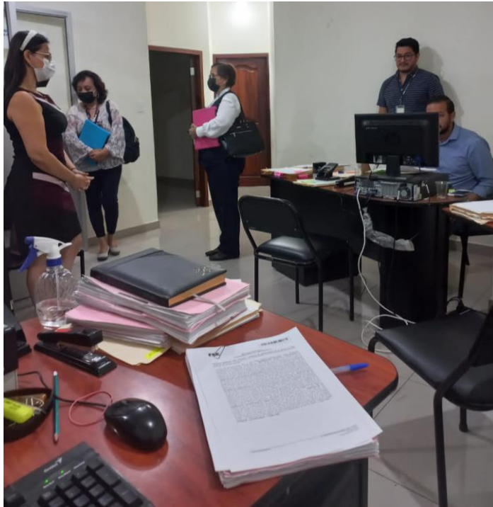
Imagen 6. Visitas a los diferentes Cantones de la Provincia de Manabí en el año 2022.

El cumplimiento de la misión que tiene la Fiscalía se refleja en la obtención de los siguientes resultados: