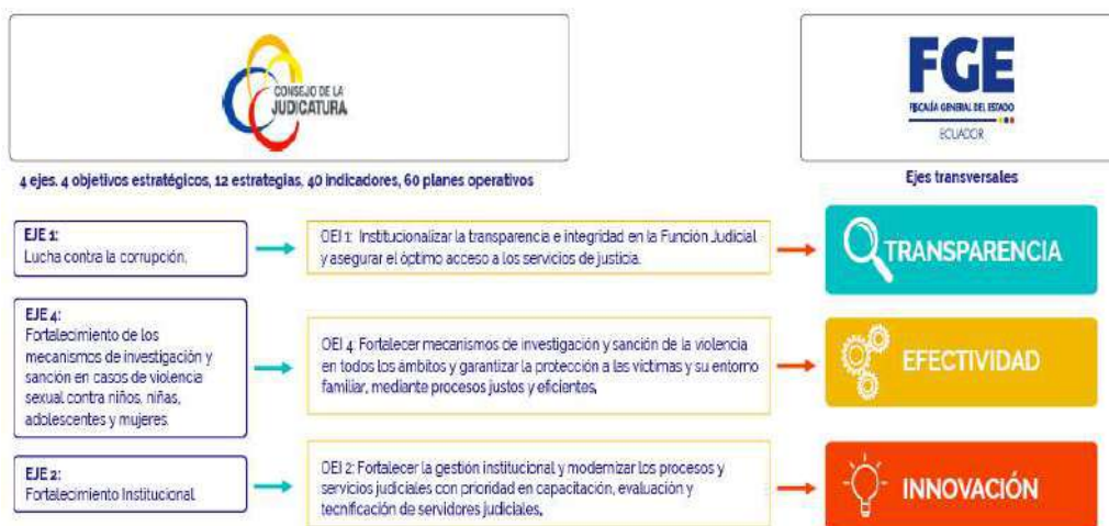
Ilustración 2 Alineación con el PEI Función Judicial – Fiscalía General del Estado Fuente y elaboración: Fiscalía General del Estado.

A continuación, se detallan las principales acciones y resultados de la gestión institucional al 31 de diciembre de 2022 de la Fiscalía General del Estado, en concordancia con los ejes de gestión.