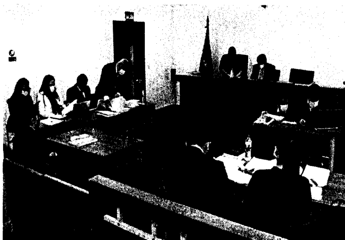
Audiencia de formulación de cargos, 9 de noviembre de 2021, Corte Provincial de Justicia de Pichincha.