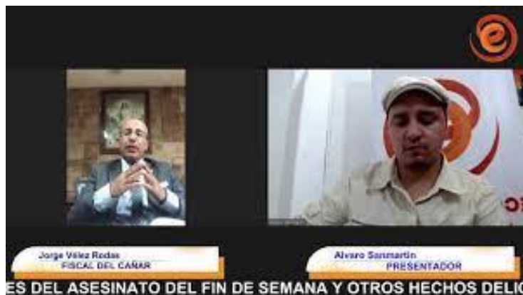
Ilustración 1 Entrevista para dar a conocer casos relevantes y de conmoción social

Mediante ruedas de prensa y acceso de la misma (prensa) a noticias sobre procesos; se ha dado a conocer a la ciudadanía sobre los niveles de eficacia de la Fiscalía en los procesos penales en desarrollo y de los logros de sentencias; esto siempre con apego a lo que la ley permite en cuanto a la publicación y acceso a la información sobre procesos penales.