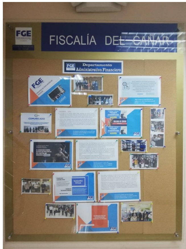
Ilustración 3 Paleógrafo informativo sobre proceso evaluación

Con el ánimo de establecer procesos de transparencia se estableció una cartelera informativa sobre el proceso de evaluación de fiscales; lo que va de la mano con alguna queja que la ciudadanía quisiera interponer a cualquier acción fiscal.