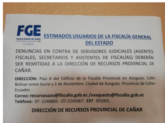
Ilustración 2 Letrero para promover denuncias hacia la ciudadanía

Se promovió a la ciudadanía la viabilidad de presentar las quejas a través del portal de la Fiscalía General del Estado; al igual que poderlas realizar por los canales provinciales, esto es en forma presencial y por los correos institucionales, para ello en todas las dependencias fiscales (cantoniales) se colocó letreros en donde se motivaba a presentar las quejas a los correos de la Señora Directora Provincial de Recursos y de la Fiscalía Provincial, con el propósito de dirigirlas a los órganos pertinentes para su tramitación.