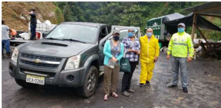
Equipo del SPAVT Morona Santiago en la entrega de alimentos a víctimas en el cantón Taisha

El Art. 198 de la Constitución de la República del Ecuador, en su artículo 198 establece: “La Fiscalía General del Estado dirigirá el sistema nacional de protección y asistencia a víctimas, testigos y otros participantes en el proceso penal, para lo cual coordinará la obligatoria participación de las entidades públicas afines a los intereses y objetivos del sistema y articulará la participación de organizaciones de la sociedad civil.