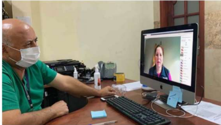
Capacitación virtual a médicos del Distrito 14D03

En coordinación con los Distintos Distritos de Salud de la Provincia se efectuaron capacitaciones virtuales a los médicos que se incorporan anualmente a los distintos puestos de salud en comunidades y cantones, explicando la importancia de su trabajo y profesionalismo en la atención a víctimas de violencia intrafamiliar y de género, sobre la aplicación de la Norma Técnica de Violencia de Género y las normas del Código Orgánico Integral Penal con sus respectivas reformas como un camino a la erradicación de la violencia y a evitar la impunidad, lo que nos ha permitido contar con una mejor respuesta del sistema de salud que resulta indispensable, ya que la Fiscalía de Morona Santiago cuenta únicamente con dos médicos peritos para la atención en los diferentes delitos y cantones. Se desarrollaron cuatro eventos de capacitación con lo que se atendió a los cantones: Taisha, Gualaquiza, Limón, Sucúa y Morona;