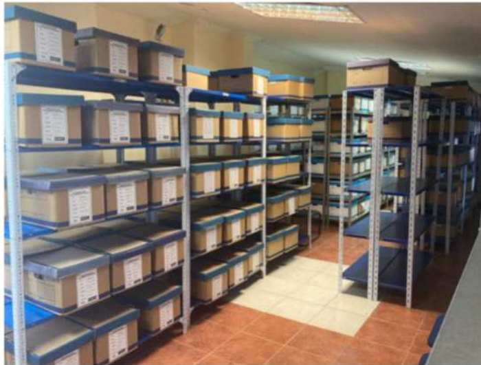
Archivo Pasivo cantón Morona

En el 2020 gracias a un arduo trabajo del personal responsable del archivo provincial durante la pandemia, se ha logrado mantener casi sin pendientes los ingresos de cajas al archivo pasivo, logrando durante todo el año un total de 6514 expedientes ingresados al SINAP a nivel provincial.