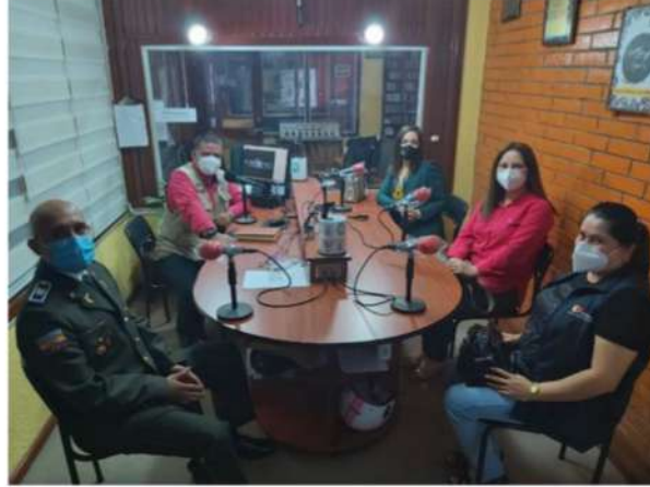
Programa de entrevista en Radio la Voz del Upano

En los medios institucionales también se han difundido 25 boletines de prensa con casos de relevancia a nivel Provincial, actividad que ha permitido que se conozca el trabajo efectivo de la Fiscalía y las respuestas a nivel judicial.