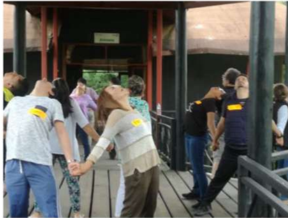
Taller de autocuidado y sensibilidad