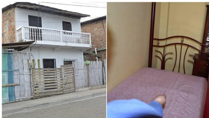
Imagen 8. Lugar de los hechos.