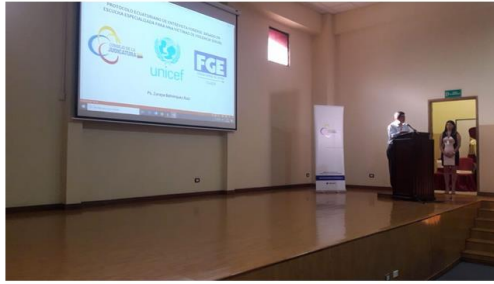
Imagen 10. Capacitaciones realizadas.