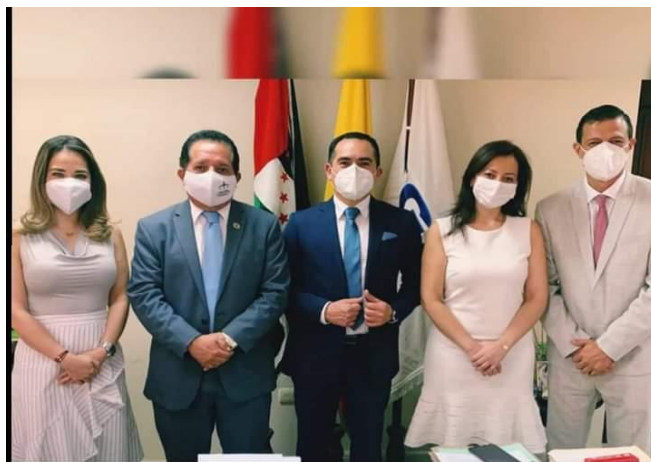
Imagen 4. Reuniones interinstitucionales en el año 2020. Fuente propia