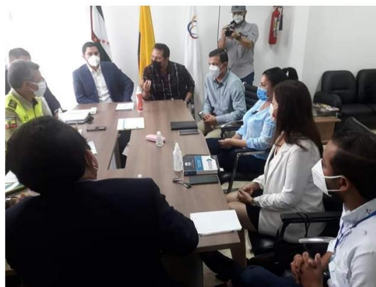
Imagen 3. Reuniones interinstitucionales en el año 2020. Fuente propia

Se fortaleció la participación de la Fiscalía Provincial de Manabí, a través de la participación activa en las diferentes mesas inter – institucionales, con los demás actores de la administración de justicia, Policía Judicial, Antinarcóticos, DEVIF, DINASED, DINAPEN, Criminalística, UIAN, Defensoría Pública Penal, Defensoría del Pueblo, Corte Provincial de Justicia de Manabí, Secretaría de Derechos Humanos, Gobernación, Ministerio de Salud de Pública, Organizaciones de la sociedad civil; con la finalidad de coordinar el trabajo y obtener mejores resultados.