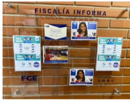
Imagen 1. Cartelera informativa ubicada en la entrada. Fuente propia.