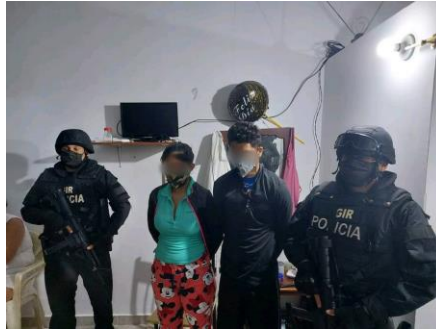
Imagen 7. Lugar de los hechos.