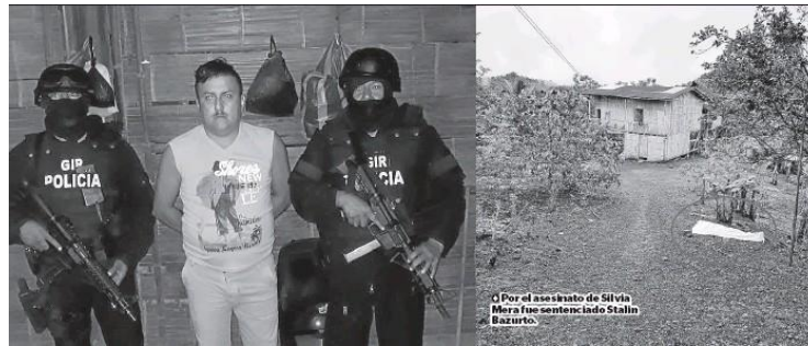
Imagen 9. Lugar de los hechos.