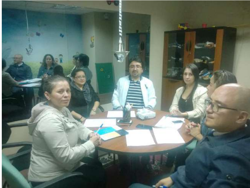
Ilustración 6 Reunión de trabajo para capacitación a inicios del 2020