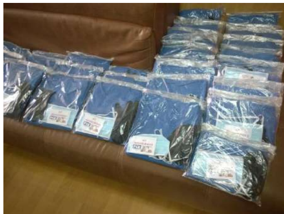
Ilustración 4 KIT de Bioseguridad para Servidores Fiscales