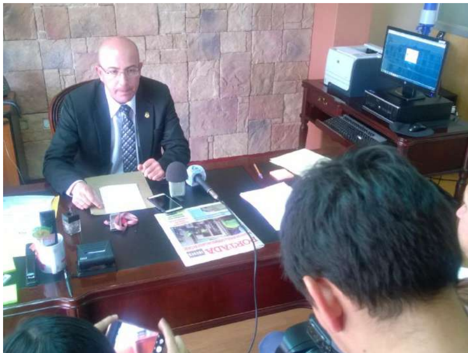
Ilustración 1 Rueda de prensa para dar a conocer casos relevantes y de conmoción social