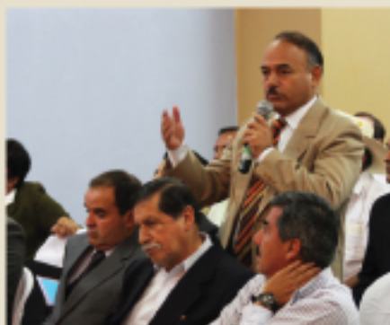
Ex alcalde de Macará

Por estos trabajos, se pagó una cantidad superior a los 360.000 dólares cuando el costo real, según investigaciones de la Contraloría, no superaba los 200.000 dólares.