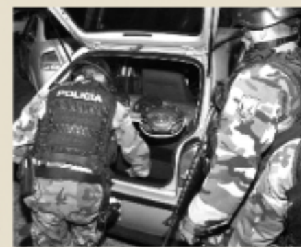
Operativo policial