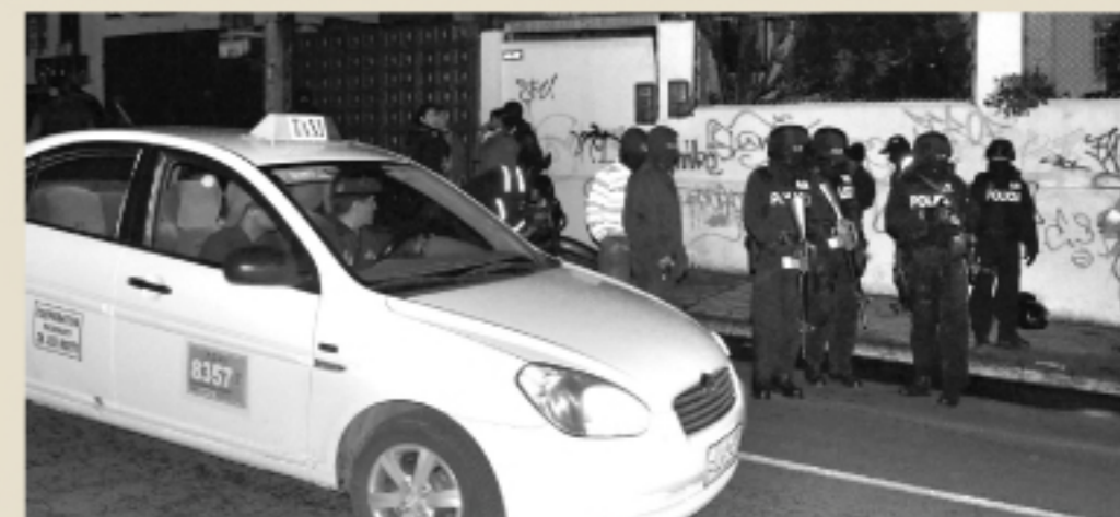
Operativo "Amanecer"