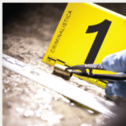
Caso medicina forense