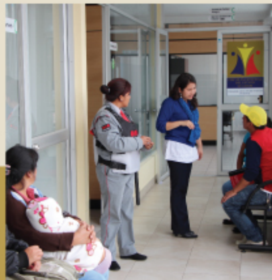
Servicios SAI fotos Fiscalía

El SAI atiende diariamente de 08:00 a 17:00, de forma ininterrumpida y gratuita.