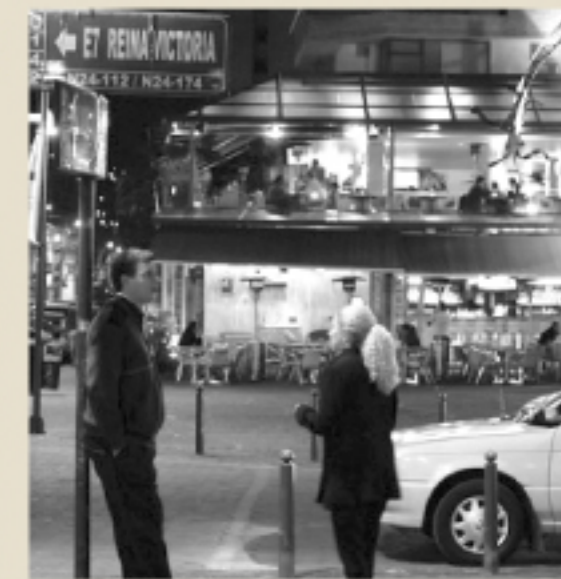
Sector La Mariscal en la noche