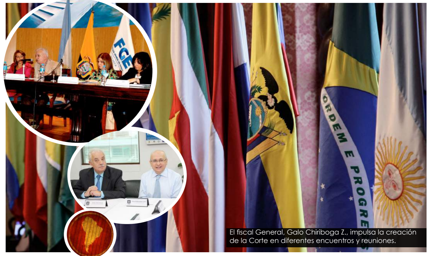
El fiscal General, Galo Chiriboga Z., impulsa la creación de la Corte en diferentes encuentros y reuniones.

La creación de la Corte Penal para la Unión de Naciones Suramericanas (Unasur) constituye otro de los pilares del trabajo de la Fiscalía General del Estado. El objetivo es investigar penalmente al menos 13 delitos transnacionales como narcotráfico, trata de personas, lavado de activos, corrupción y otros.