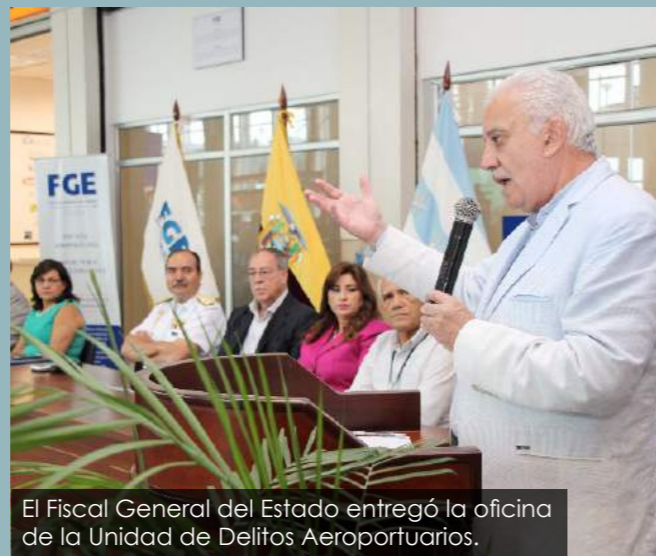
El Fiscal General del Estado entregó la oficina de la Unidad de Delitos Aeroportuarios.

Otra manera de presentar una denuncia es ante los funcionarios de la Unidad. En este caso, un asesor receptorá los datos del perjudicado y los detalles sobre lo ocurrido.