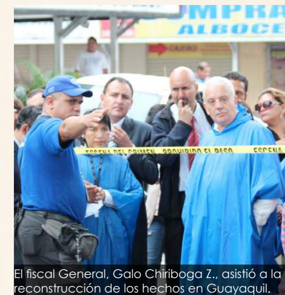
El fiscal General, Galo Chiriboga Z., asistió a la reconstrucción de los hechos en Guayaquil.

13 sentenciados: 6 a 16 años; 6 a 2 años; uno ratificada su inocencia