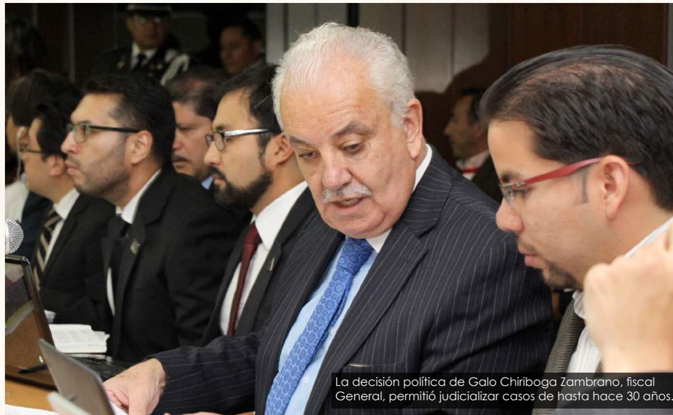
La decisión política de Galo Chiriboga Zambrano, fiscal General, permitió judicializar casos de hasta hace 30 años.

D iez casos judicializados, tres de estos con sentencias condenatorias, es el resultado de las investigaciones en Derechos Humanos, por gestión de Galo Chiriboga Zambrano desde el 2011, cuando asumió el cargo de Fiscal General.