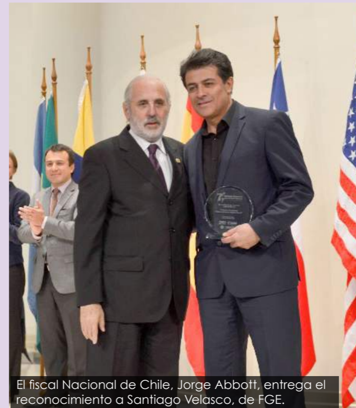
El fiscal Nacional de Chile, Jorge Abbott, entrega el reconocimiento a Santiago Velasco, de FGE.

La Fiscalía General del Estado ecuatoriano recibió un reconocimiento a las buenas prácticas aplicadas en el ámbito de la investigación penal, por el uso del sistema de monitoreo de delitos 'Geoportal'.