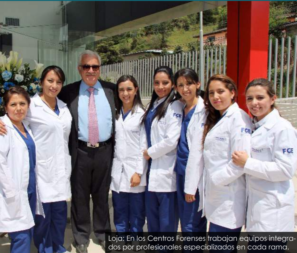
Loja: En los Centros Forenses trabajan equipos integrados por profesionales especializados en cada rama.

Los Centros de Investigación de Ciencias Forense significaron superar el trato inhumano a las víctimas y a sus familias.