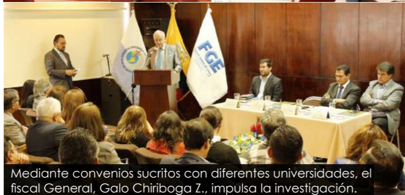
Mediante convenios suscritos con diferentes universidades, el fiscal General, Galo Chiriboga Z., impulsa la investigación.