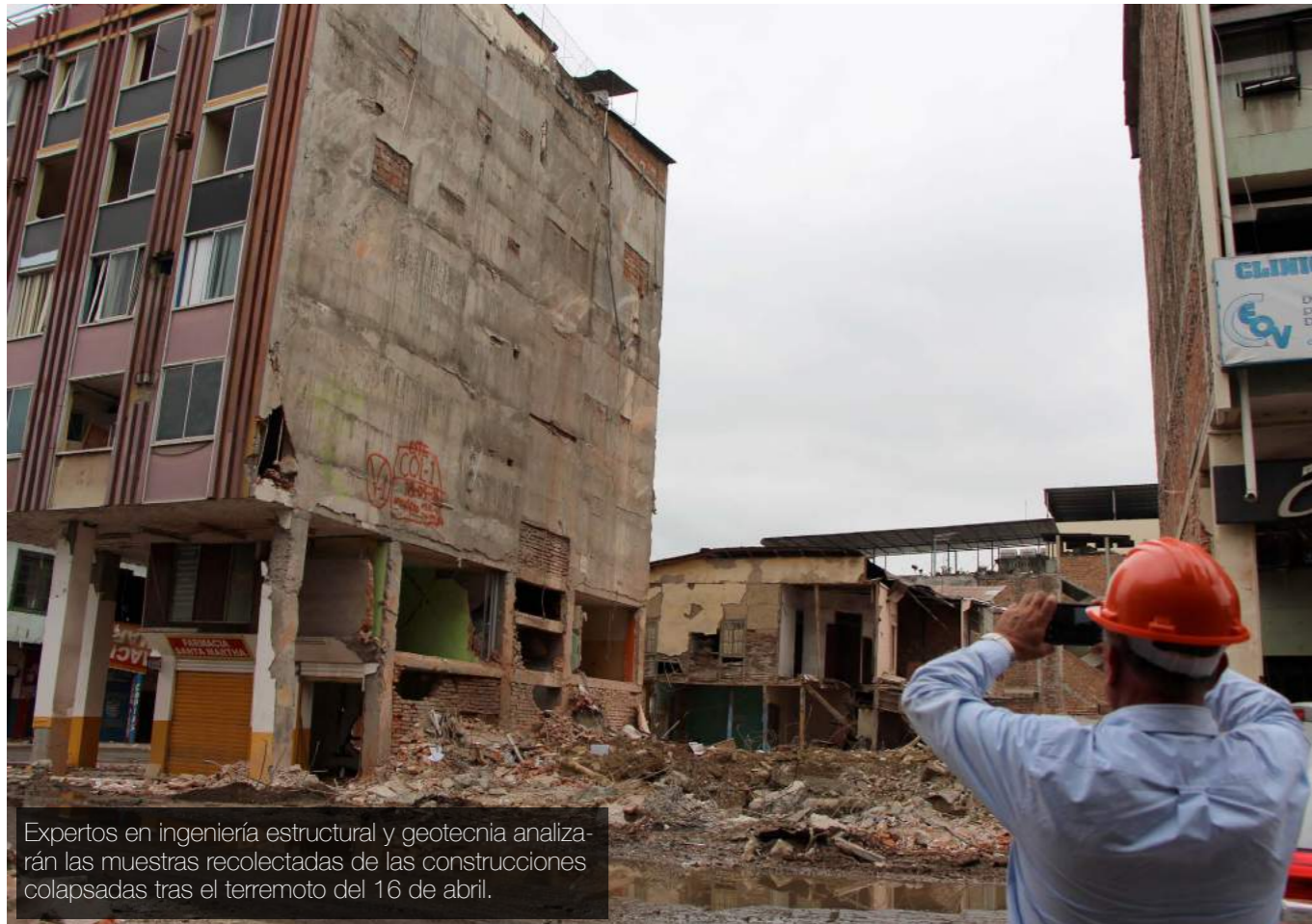
Expertos en ingeniería estructural y geotecnia analizarán las muestras recolectadas de las construcciones colapsadas tras el terremoto del 16 de abril.