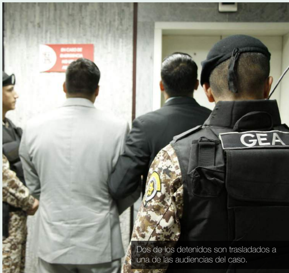
Dos de los detenidos son trasladados a una de las audiencias del caso.

Esta estructura delictiva vendía los traslados policiales en 1.000, 1.500 y 2.000 dólares.