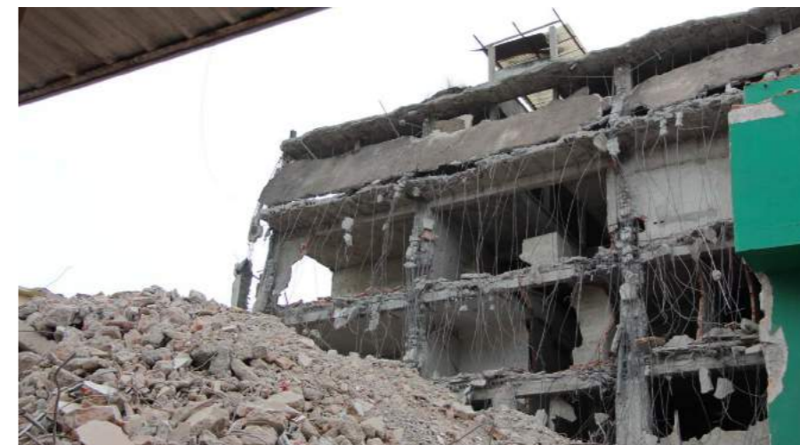
Muestras de 95 edificaciones colapsadas son analizadas por expertos en estructura y geotecnia

También se recopiló información fotográfica (ortofotos, una especie de captaciones aéreas) conservada por los municipios.