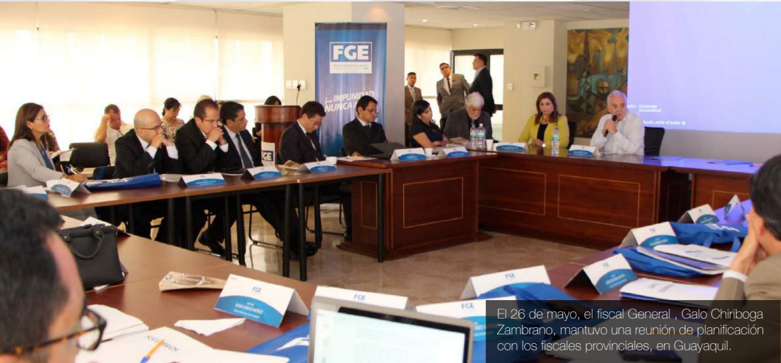
El 26 de mayo, el fiscal General, Galo Chiriboga Zambrano, mantuvo una reunión de planificación con los fiscales provinciales, en Guayaquil.

Durante los próximos años, impulsarán su trabajo hacia el combate contra la impunidad en los delitos en sus respectivas provincias.