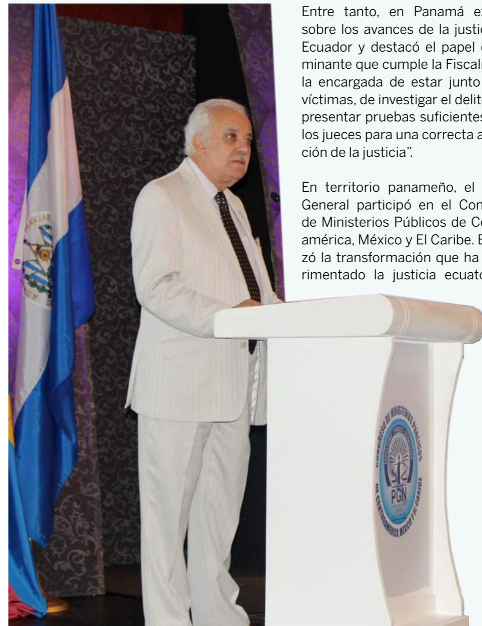
El fiscal General, Galo Chiriboga, habló sobre los avances en la justicia.

Asimismo, durante su participación en Panamá señaló que desde agosto del 2014, Ecuador cuenta con el Código Orgánico Integral Penal (COIP). Este cuerpo penal tipificó nuevos delitos como el femicidio (entendido como la violencia expresada al máximo contra la mujer), propuesta liderada por la Fiscalía.