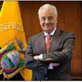
Galo Chiriboga Zambrano FISCAL GENERAL DEL ESTADO